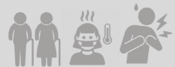
Наибольшее количество смертей наблюдается среди пожилых людей и людей с сопутствующими хроническими заболеваниями