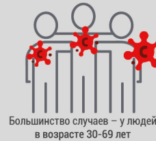
Большинство случаев – у людей в возрасте 30-69 лет

Эпидемиологический анализ ВОЗ и Центров по контролю и профилактике заболеваний показал, что представители уязвимых групп, в том числе пожилые люди, люди с хроническими заболеваниями и люди с ослабленным иммунитетом (люди с заболеваниями сердца, диабетом и респираторными заболеваниями) в наибольшей степени подвержены риску смерти от COVID-19; данные группы населения должны быть в центре ответных усилий.